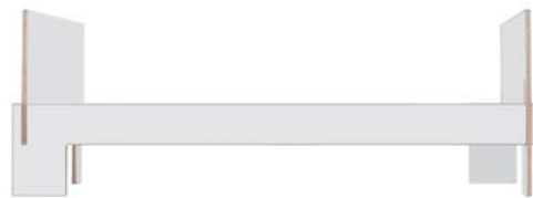
mit Kopf- und Fußteil/with head - and footboard